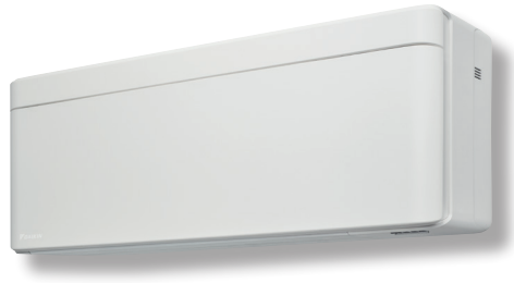
Daikin Stylish XRH 30 – innovativ design med inbyggd WiFi